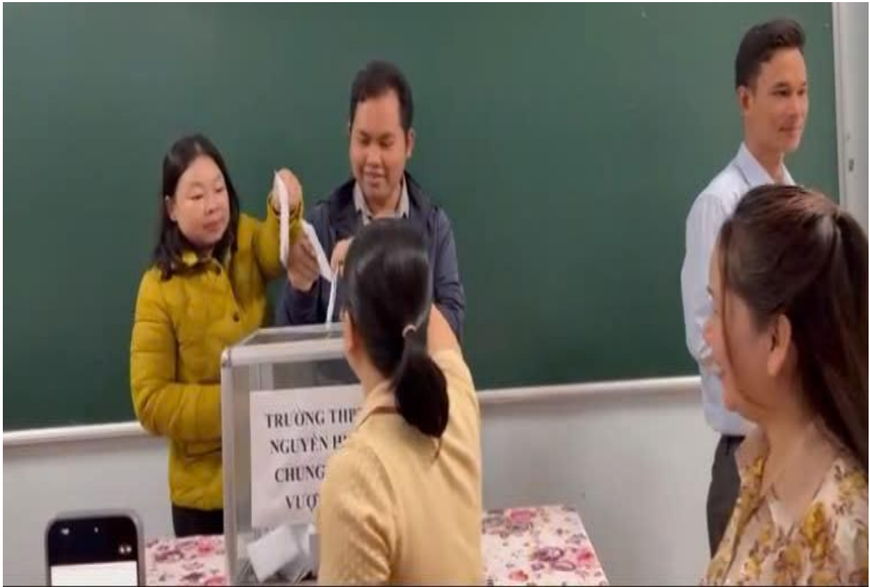
Thầy cô giáo, cán bộ nhân viên nhà trường quyên góp ủng hộ đồng bào miền Bắc bị thiệt hại do bão số 11