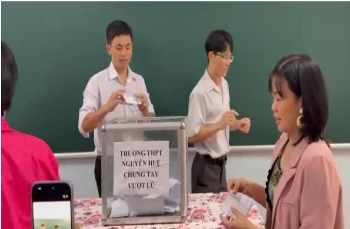
Thầy cô giáo, cán bộ nhân viên nhà trường quyên góp ủng hộ đồng bào miền Bắc bị thiệt hại do bão số 11