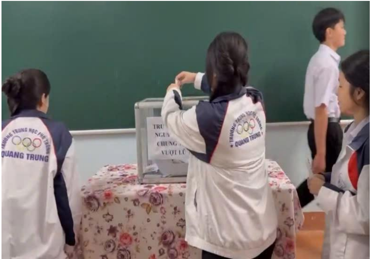
Các em học sinh nhà trường quyên góp ủng hộ đồng bào miền Bắc bị thiệt hại do bão số 11