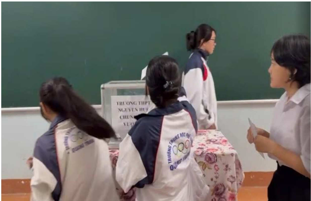
Các em học sinh nhà trường quyên góp ủng hộ đồng bào miền Bắc bị thiệt hại do bão số 11